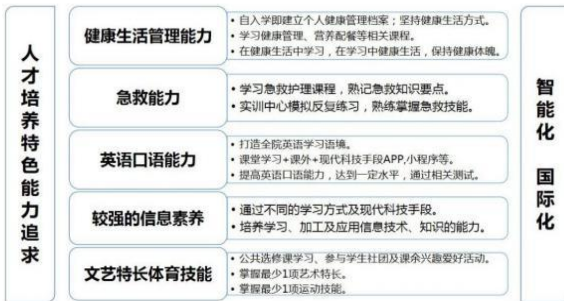
图1 学院人才培养目标