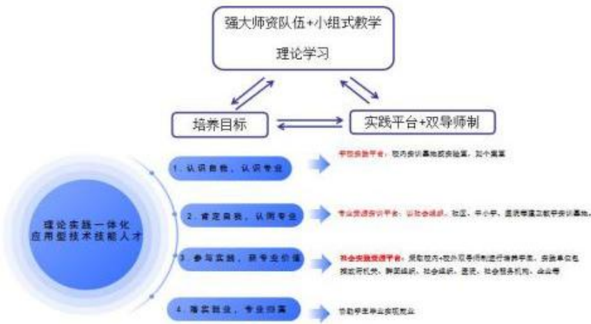
图3 理论与实践一体化专业人才培养框架